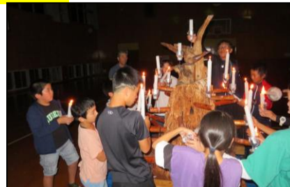
【友情を誓ったキャンドルの集い】