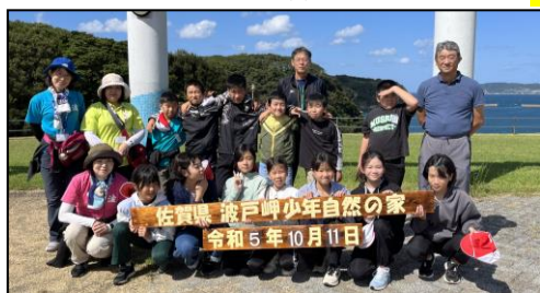
【青い空 青い海 最高の気候】