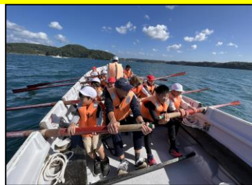
【息を合わせたカッター】