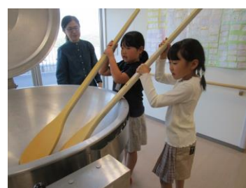
【大鍋と大しゃもじにビックリ】