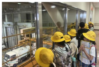
【ゴミが運ばれる様子を見学】

実際に目にしたり手にとったりした経験は、子どもたちの記憶にしっかり刻まれたことでしょう。普段の生活で「ごみ減量」「給食への感謝」の気持ちにつながることを期待しています。